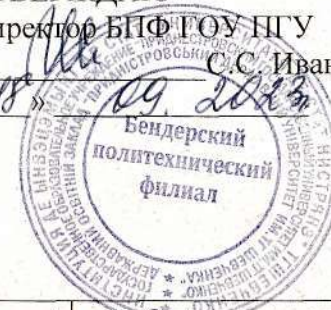
ГРАФИК ПРАКТИК студентов НПО и СПО на 2023-2024 учебный год